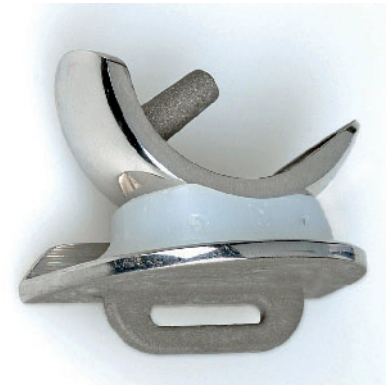
Abbildung 3 Oxford-III-Prothese für den unikondylären medialen Kniegelenkersatz mit mobilem Inlay.

KSS, WOMAC, OKS und die allgemeine Patientenzufriedenheit mit der UKA-Implantation waren deutlich besser/höher in der aktiven Patientengruppe, was auch in anderen Studien beobachtet wurde [6, 10]. Körperlich aktive Patienten gaben auch weniger Schmerzen an. In den Bereichen „Belastungsschmerz“ und „Schmerz beim Treppen-