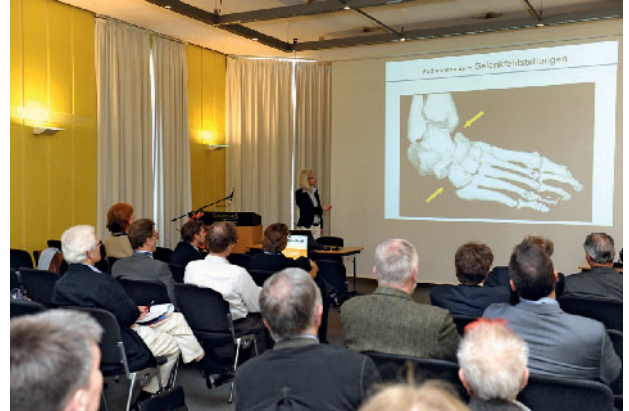
Neu ist die ASG-Akademie: Spezielle Assistentenworkshops werden von ASG-Fellows gestaltet.

die technischen Neuheiten und kann auch hier unter dem Angebot an Schulungen und Workshops auswählen.