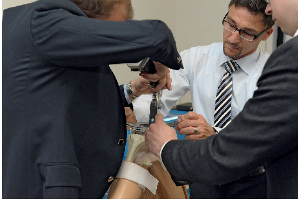
Der Kongress bietet ein hohes Maß an Wissenszuwachs in Theorie und Praxis.