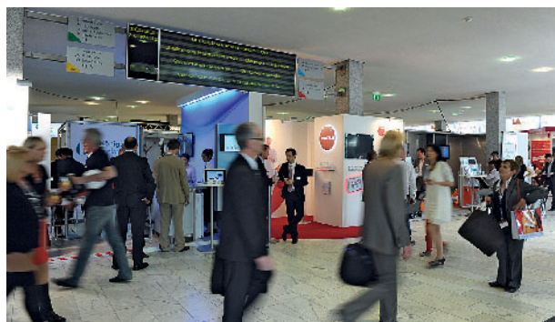
Traditionell werden in Baden-Baden ca. 3.000 Fachbesucher erwartet.