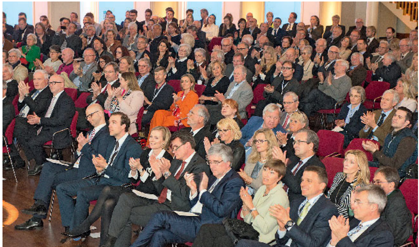
Volle Ränge bestimmen das Bild während des Kongresses.

Spannende Themen aus Grenzgebieten von O&U werden in den zwei Sitzungsblöcken „Das Ganze ist mehr ...“