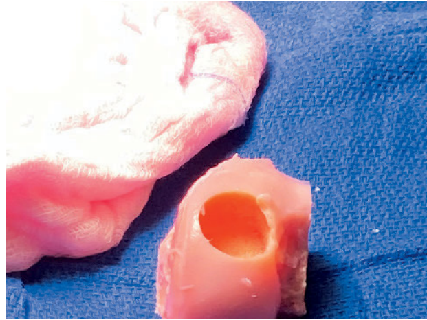
Abbildung 4 a–b Postop.: Gebrauchte Anker einer Meniskusnaht und verwendetes osteochondrales Allograft