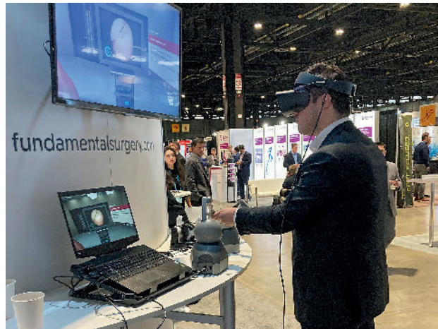
Abbildung 6 Auf dem neuesten Stand: Virtuelles Austesten einer OP-Technik im Rahmen des AAOS