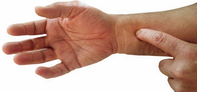
Abbildung 3 Akupunkturpunkt Pe 6, lokalisiert 3 Zeigefingerbreiten des Patienten proximal der distalen Handgelenkebeugefalte zwischen den Sehnen von M. palmaris longus und M. flexor carpi radialis.

weise zur Beeinflussung der Maximal- und Schnellkraft [21, 22, 23] und Regenerationszeit bei Muskelkater [24] bei Sportlern sowie Verbesserung des Gangbilds bei geriatrischen Patienten [25] sollte in größeren Studien noch ausführlicher nachgegangen werden, um eine Aussage zur tatsächlichen Wirksamkeit liefern zu können.